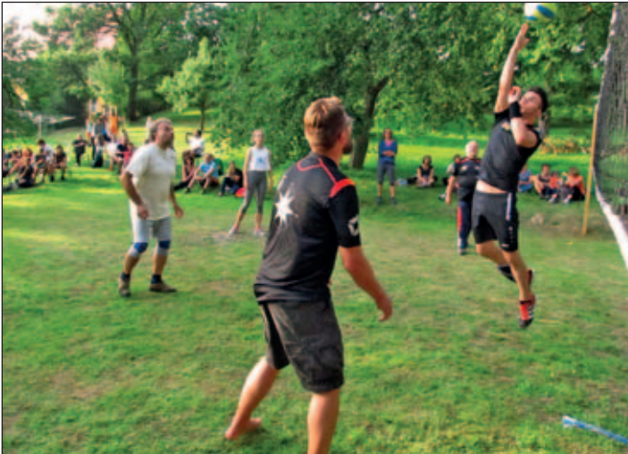
Voll in Aktion - die Mannschaft aus Petersberg und Leuben

„Geht nicht gibt´s nicht“ – so ein alter Handwerkerspruch. So erlebten wir es auch am 25. August auf dem Volleyballfeld im Pfarrgelände Rüsseina. Kinder der 4. Klasse gegen „alt gediente Hasen“ im Volleyball? Doch, es geht. Die Kleinen konnten im „Ball-über-die-Leine-Modus“ spielen. Da hatten die Großen ganz schön zu tun. Sieger war die Mannschaft der Jungen Gemeinde Wendischbora. Zweiter wurde der Kirchenvorstand und als Dritte ging die Mannschaft Petersberg/Leuben aus dem Wettkampf hervor. Was für ein schönes Miteinander von Groß und Klein! Am Ende konnten sich alle an der Siegertorte ergötzen.