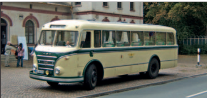
Der H6-Oldtimerbus wartet auf seine Fahrgäste.