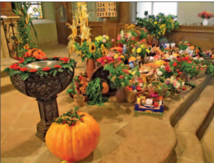
Erntefarbenpracht in der Kirche Rüsseina

Was fehlt dir und mir am Glücklich sein? Gibt es das überhaupt – vollkommenes Glück oder mache ich mich nicht erst recht unglücklich, wenn ich nur noch auf das sehe, was zum Glück noch fehlt? Erntedank heißt: Ich schaue auf das, was Gott mir als Reichtum geschenkt hat. Das meiste davon ist in Euros nicht auszudrücken. Der bunte Erntedankschmuck und die Gaben zum Erntedankfest zeugten von Freude und Dankbarkeit. Viele Helfer hatten über 20 frische Blumen-Kränze gewunden. Wie schön, dass eine Kindergruppe aus dem Kindergarten Lüttewitz diese Pracht mit bewundern konnten.