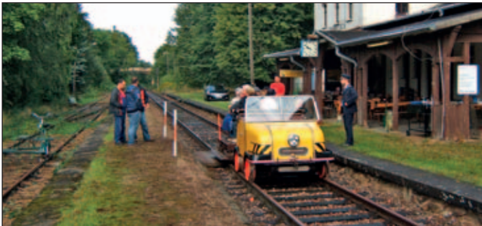
Die Morgensonne begrüßt die ersten Fahrgäste zum Saisonschluss.

Förderverein Eisenbahn in der Lommatzschener Pflege e. V.; Mutzschwitz 14, 01683 Nossen, Internet: http://www.felp.de , Tel.: 035246/51720 oder 035241/58931