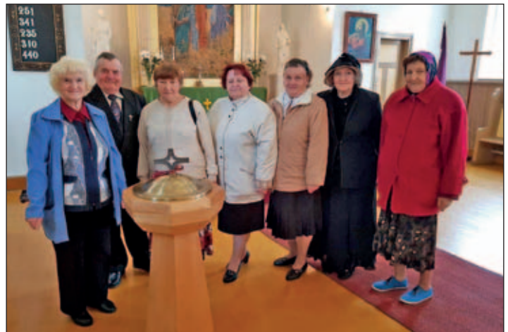
Gemeindemitglieder in Vilaka vor ihrem neuen Taufstein

Das hatten wir nicht alle Tage. Am 28. Juli hielt ein großer Reisebus vor dem Pfarrhaus Rüsseina. Über 40 Gäste aus den lettischen Kirchgemeinden Balvi, Karsava, Tilza und Vilaka waren für fünf Tage Gast in Rüsseina und Meißen. Natürlich stand in diesen Tagen der Besuch der Lutherstätten in Wittenberg, Eisleben und Hirschfeld auf dem Programm. Ein besonderer Höhepunkt aber war für uns der gemeinsame Festgottesdienst am 30. Juli in Wendischbora. Hier konnten wir unserer Partnergemeinde Vilaka einen neuen Taufstein übergeben (der aus Holz ist). In Lettland tauft man aus einer gereichten Schale heraus. Nun war es der Wunsch in Vilaka: „Ach, wenn wir doch einen richtigen Taufstein hätten wie ihr“. Dies konnte nun in Erfüllung gehen. Eine Gravur zeigt ein Bibelwort in Lettisch und unterseitig eine Widmung unserer drei Gemeinden zum Lutherjahr. Danke allen Spendern, die dies mit möglich gemacht haben. Danke allen, die die lettischen Gäste beherbergt haben!